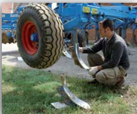
Snabbt och enkelt spetsbyte